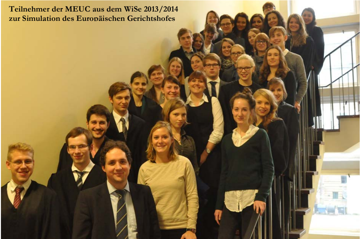
Teilnehmer der MEUC aus dem WiSe 2013/2014 zur Simulation des Europäischen Gerichtshofes

Einzelheiten zu den laufenden Sitzungen sowie Berichte über die Simulationen sind auf der Webseite der Model European Union Conference http://www.meuc.eu zu finden. Hier gibt es auch links zu den Video-Berichten über die Sitzungen, die über YouTube abrufbar sind. Als Ansprechpartner steht Mihai Corman unter info@meuc.eu zur Verfügung.