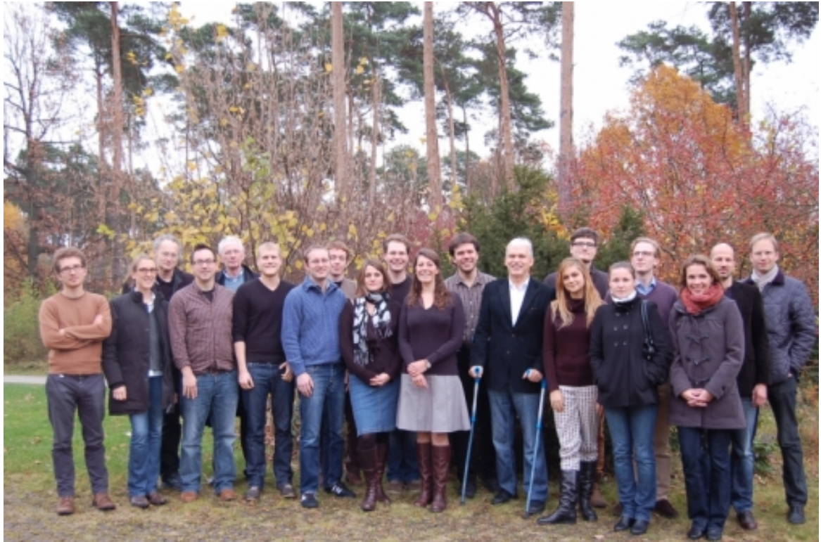
Die aktuell dritte Generation der Grakov-Stipendiatinnen und Stipendiaten

ßerdem wurde der wissenschaftliche Austausch durch kurzzeitig geförderte Gastkollegiatinnen und -kollegiaten bereichert.